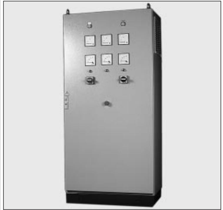
DAVRLU 400/20S 3-714-40-300