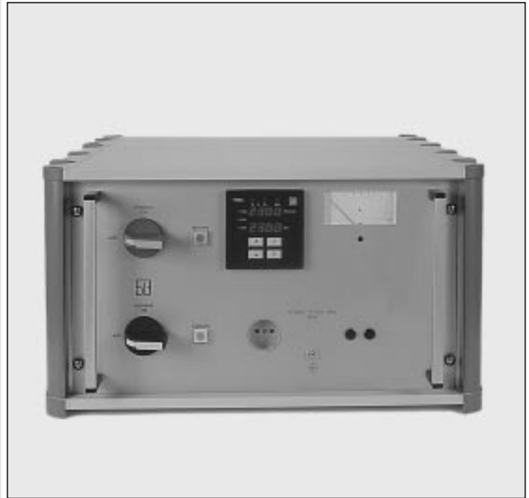
AVRLM 260/6.3 3-735-00-006