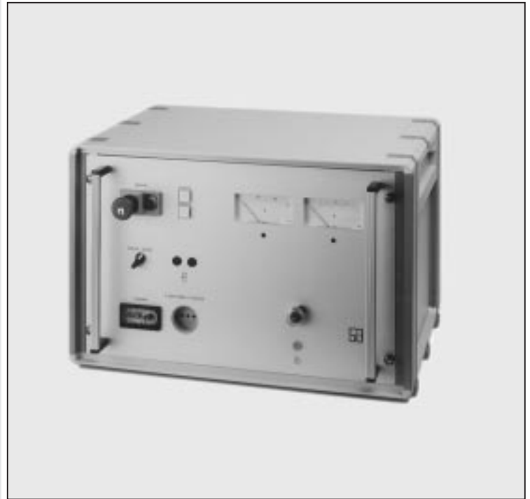
AVRL 260/15S 3-725-01-015