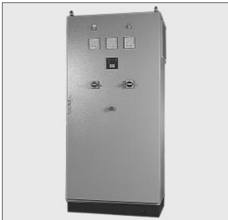
DAVRLM 400/50 3-713-40-500