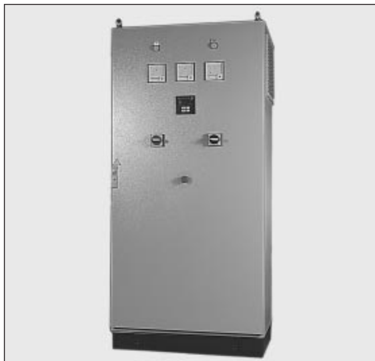
DAVRLM 400/36S 3-714-40-500