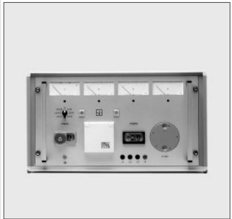
DSPT 500/3.2 3-710-50-600