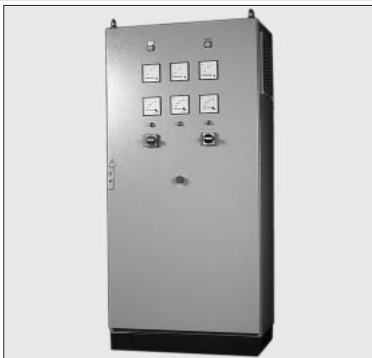
DAVRLU 450/25 3-715-45-300