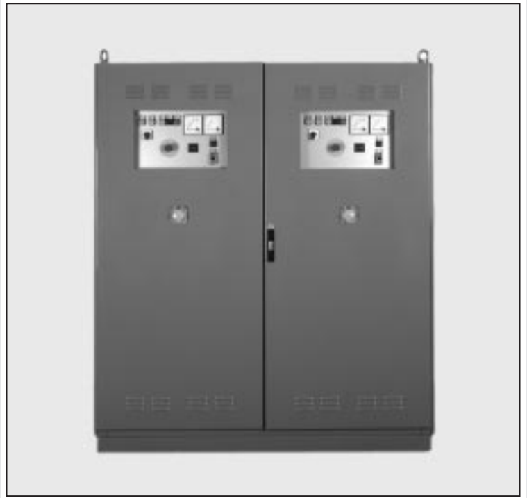
2 x DSPS 660/25