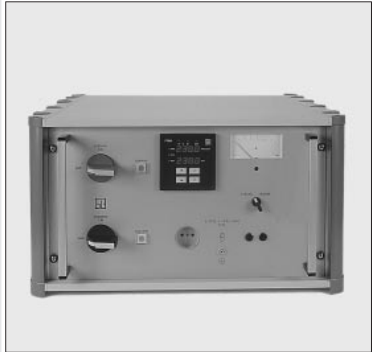
AVRLM 260/6.3S 3-735-01-006