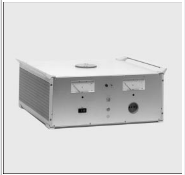
ESPT 270/15S-0 3-750-00-750