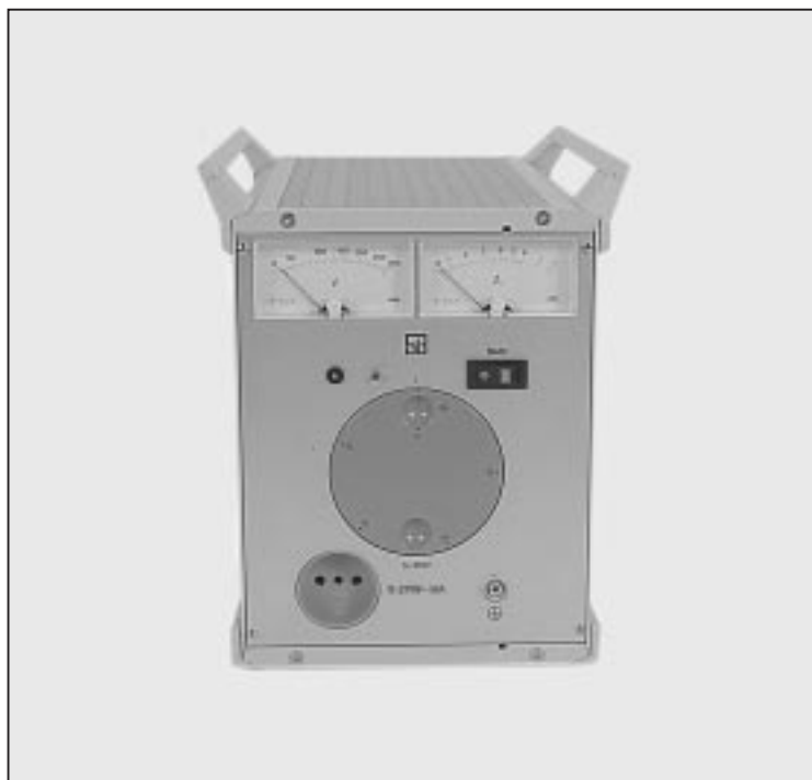
ESPT 270/6.3 3-751-00-350