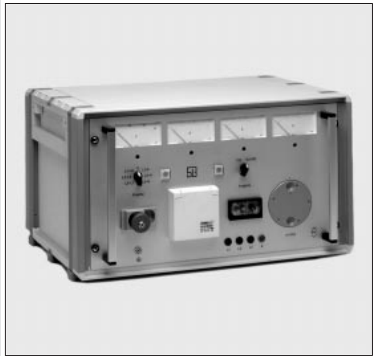
DSPT 600/2.5S 3-710-50-700