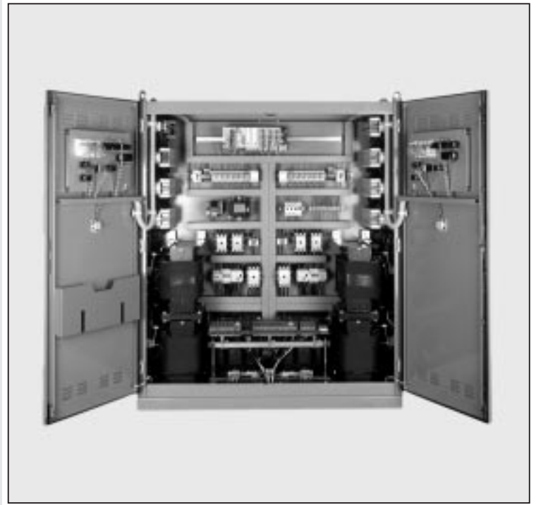
2 x DSPS 660/25